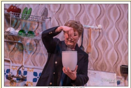
PARASKENIA TEATRO - "LA VIÑA" Teatro Victoria - Talavera de la Reina 12-04-2019