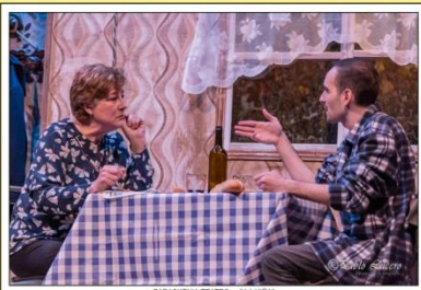
PARASKENIA TEATRO - "LA VIÑA" Teatro Victoria - Talavera de la Reina 12-04-2019