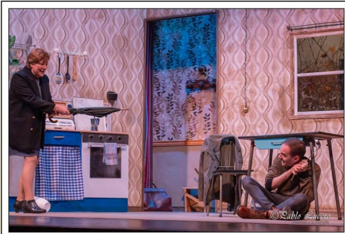
PARASKENIA TEATRO - "LA VIÑA" Teatro Victoria - Talavera de la Reina 12-04-2019