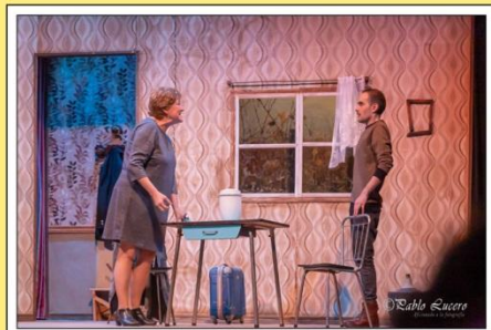
PARASKENIA TEATRO - "LA VIÑA" Teatro Victoria - Talavera de la Reina 12-04-2019