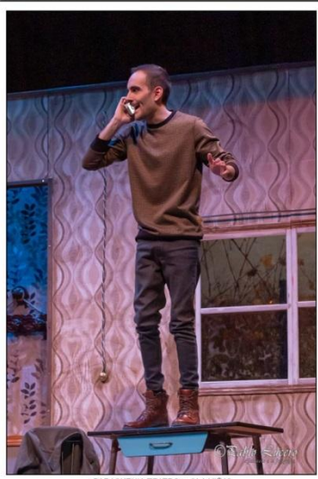
PARASKENIA TEATRO - "LA VIÑA" Teatro Victoria - Talavera de la Reina 12-04-2019