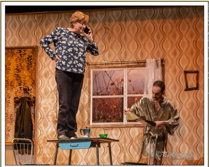
PARASKENIA TEATRO - "LA VIÑA" Teatro Victoria - Talavera de la Reina 12-04-2019