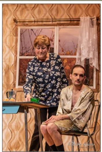
PARASKENIA TEATRO - "LA VIÑA" Teatro Victoria - Talavera de la Reina 12-04-2019