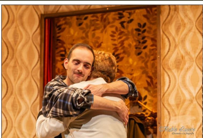
PARASKENIA TEATRO - "LA VIÑA" Teatro Victoria - Talavera de la Reina 12-04-2019